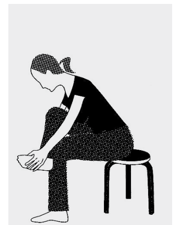
Beide Füße nacheinander erfassen, betasten und kneten, das Sprunggelenk eigens massieren.