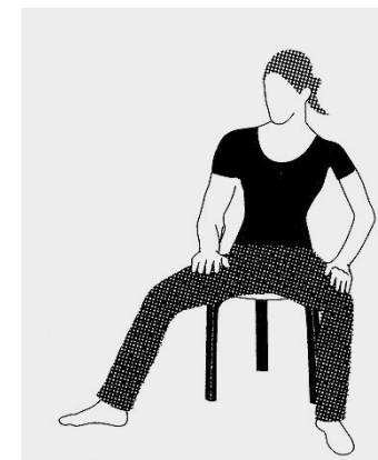
Füße abwechselnd über den Boden gleiten lassen, aufheben und in der Luft bewegen. Der Atem fließt ruhig.